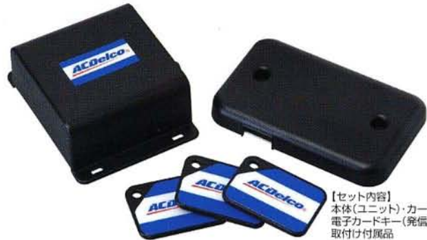
【セット内容】 本体(ユニット)・カードリーダー(受信機) 電子カードキー(発信機/3個)・接続ハーネス 取付け付属品

愛車の盗難防止対策は、欧米では常識化。 今後日本市場においても、「自分のクルマは、自分で守る時代へ」。