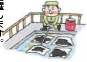
▶工場の油水分離槽