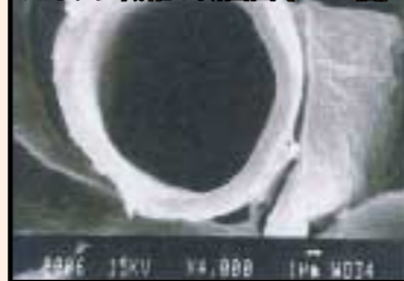
カポック繊維の断面図(4000倍)

モンスターキャッチャーは、植物系セルロース繊維が主原料(カポック)です。主産地はジャワでスマトラ、インド、タイ、インドネシア半島に産し、高さは10~15メートルに達します。実は長さ10センチほどです。