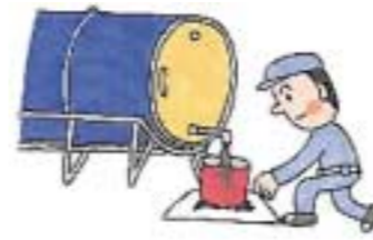
▶ドラム缶置き場で