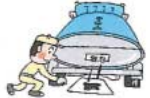
▶タンクローリーの漏油